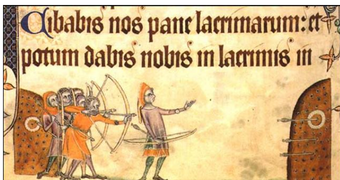
Initiering av bågskytta. Manuskript från år 1325.